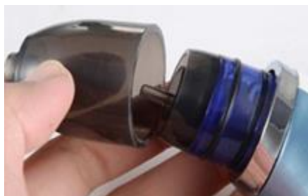
Installez la protection et tournez-le dans le sens des aiguilles d'une montre Pour finir, installez l'embout