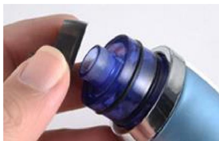
Installez le cache du compartiment de stockage.