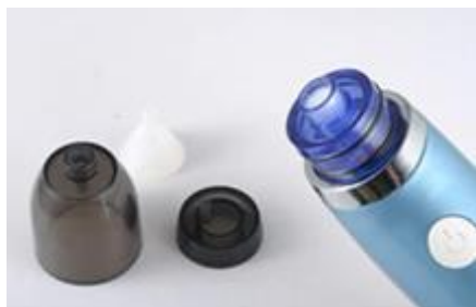
Pièces à installer.